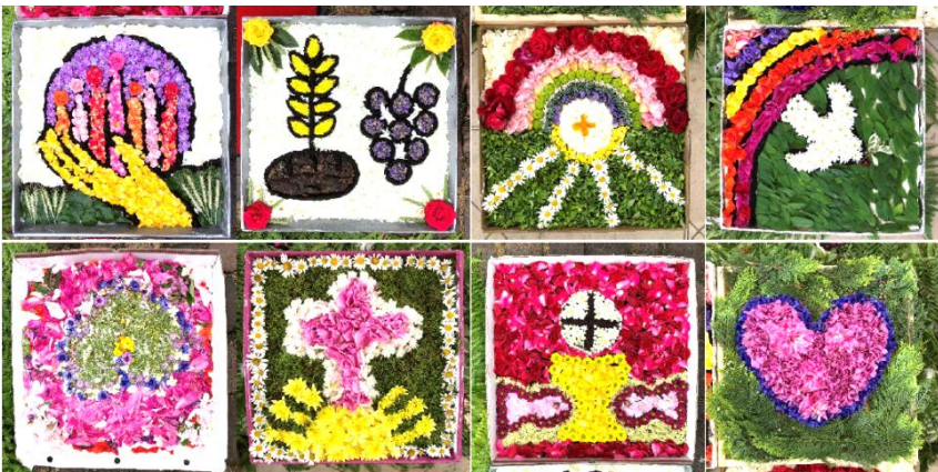
05/2021 | Alle Fotos: Bistum Fulda/Peter Zürcher

Sowohl in Moosbach als auch in Eslarn sind heuer unsere Erstkommunionkinder zum ersten Mal eingeladen, das Fronleichnamsfest durch einen eigenen Blumenteppeich zu bereichern – und zwar als „ Blumenteppeich im Pizzakarton “! Wir freuen uns schon auf ihre Kunstwerke („ein Mosaik aus Blumen“), und sagen im Voraus herzlichen Dank für ihren Beitrag zum Fronleichnamsfest!