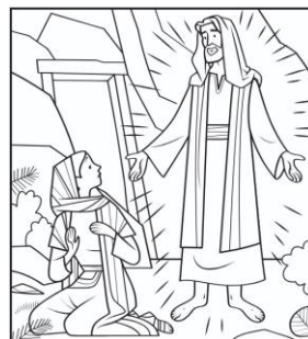
Hl. Maria von Magdala Apostola Apostolorum Apostelin der Apostel